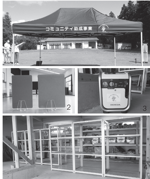
1. テント / 2. 展示用パネル・パネルスタンド 3. 発電機 / 4. 軽中量ラック