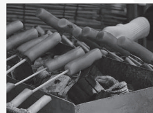
カタチもユニーク、しらたか団子