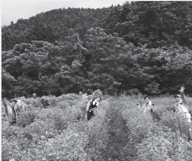
協力隊メンバーで紅花摘み

4月から配属先が白鷹町観光協会から白鷹町遊楽回廊協議会に異動になりました。ざっくりいうと、パレス松風のどか村・あゆ茶屋・どりいむ農園を盛り上げるって感じの仕事です。 今期は最後の3年目なので少し枠を超えた活動をしようと思ひ、上記施設以外にもいろいろご協力いただきながら新しい企画にチャレンジしています。 周りの環境が割と保守的で新しいことをするのに慎重派