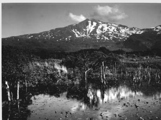
▲「湖畔に映る鳥海山」