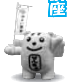
明るい選挙のイメージキャラクター「選挙のめいすいくん」