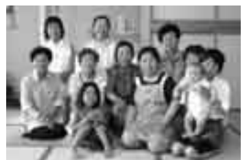
よもぎの会の皆さん