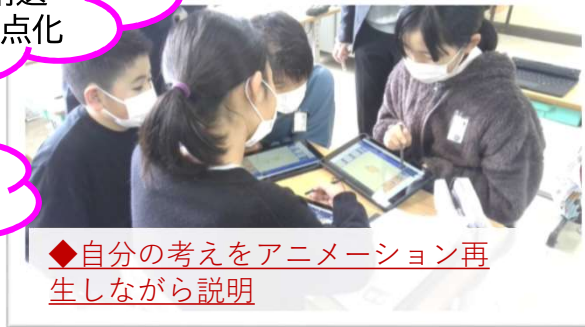
◆自分の考えをアニメーション再生しながら説明