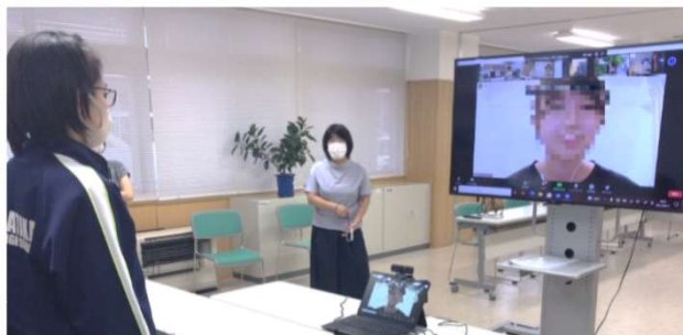
◆東京外語大学生とのオンライン交流 学校紹介の資料は、自分たちで共同編集