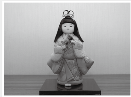
「木目込み人形作品展」