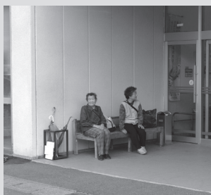
デマンドを待つ利用者

※運行日と予約受付日については、「広報しらたかおしらせ版」に「運行日・予約受付日カレンダー」として掲載する予定ですので、ご覧ください。