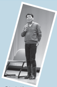
「おすぎのシネマトーク」

皆さんの時間をほんの少し分けていただいで、私たちと一緒に活動してみませんか。参加者は誰もが素人ですし、参加するに何の知識も気兼ねもいりません。