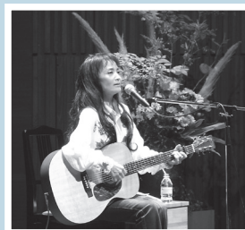
「山崎ハコ アコースティックライブ」