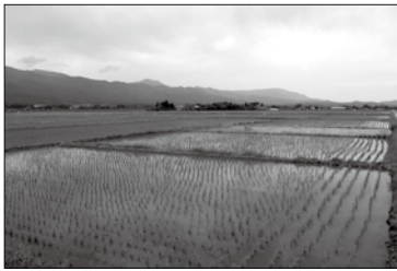
浅立地区の田んぼ

浅立地区の5ヶ区画の圃場については、効率的な作業ができるよう、基盤整備の早期着工を要望しています。