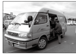
デマンドタクシー