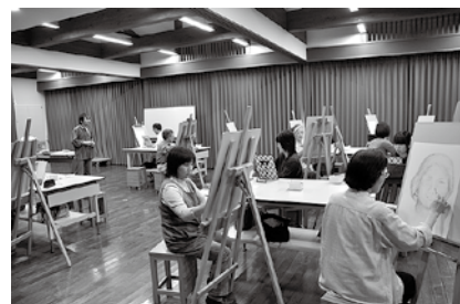
▲鉛筆画講座の様子

左記日程であゆーむ に展示いたしてお ります。ぜひ皆さんの力 作をご覧になりにお いでください。