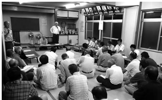
昨年開催された「まちづくり座談会」の様子

昨年度において、町民の皆さんがいきいきと生活できる住みよいまちをつくるため、第5次町総合計画の策定に向けての「まちづくり座談会」を開催させていただきました。皆さんからご意見・ご提言をいただき、計画の基本構想を策定し、現在基本計画の策定に向けて作業を行っているところです。