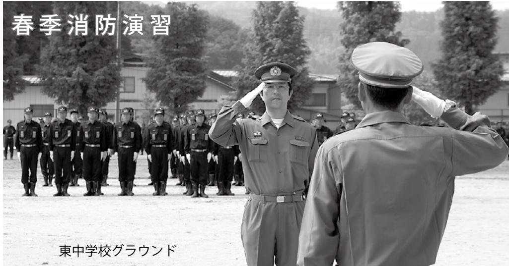
東中学校グラウンド