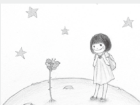
▲《星の王子様をさがして》