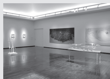
▲昨年の若手アーティスト展「白鷹21世紀展」の様子