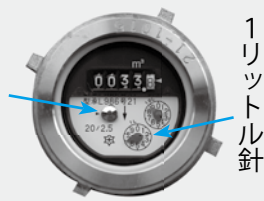
パイロットマーク

家中の蛇口を全部閉め、トイレなどの水タンクも確認してから、メーターを確認してください。銀色のパイロットマークまたは1リットル針が動いている場合は、どこかで漏水している可能性があります。ですので、町指定給水装置工事業業者に連絡し、修理を依頼してください。