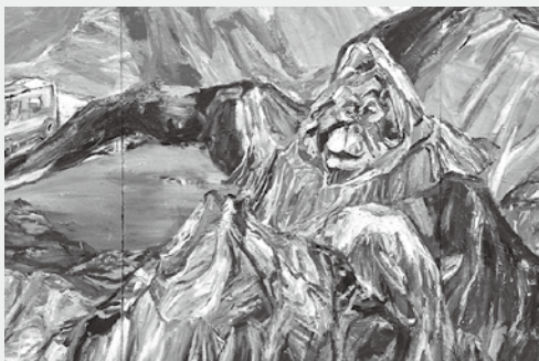
近藤亜樹《ウータン山》(部分)