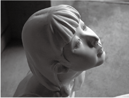
石川霞《修正ペン》(部分)