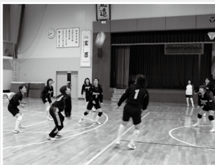
練習風景(東中学校体育館)

◆ 結成は？ ○ 昭和49年ごろです。 ◆ メンバー構成は？ ○ 川東地区の25人です。 ◆ はじめたきっかけは？ ○ 当時、婦人教育の一環として町の若妻会のバレー大会が行われるようになり、その大会を機に各地区で練習が盛んになったのがきっかけです。 ◆ 活動内容は？ ○ 各大会への参加と週1回の練習です。 ◆ 練習日は？ ○ 毎週金曜日の午後8時から東中体育館でしています。 ◆ どんな練習をしているの？ ○ おしゃべりしたり、笑い声ありの楽しい練習です。 ◆ どんなところが楽しい？ ○ 20代から？代まで幅広い世代が集まって、和気あいあいと練習し、大会では、緊張感