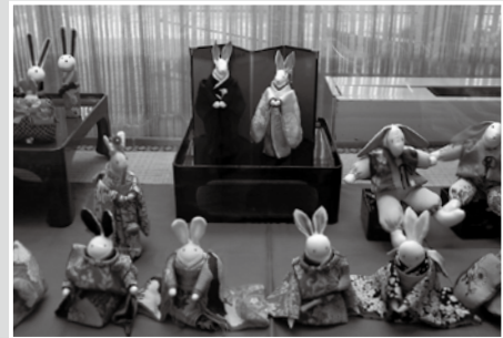
「キルトとちりめん細工展」の作品

『話し合おう! 私たちの白鷹町』をテーマに、町内の小中学校、荒砥高校の代表が発表した資料・写真を展示しています。