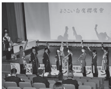
よさこい白鷹櫻鷹會