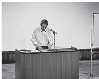
ホワイトイーグルス