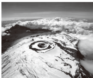
▲キリマンジャロ国立公園(タンザニア)