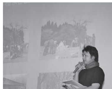
恋の種まき桜実行委員会