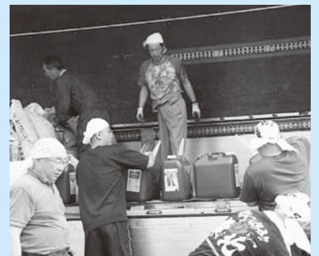
地元の水と土も運び込みます