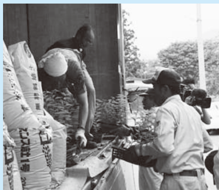
苗木は総持寺で育てられます