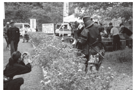
「愛の武将隊」も紅花の前で記念撮影