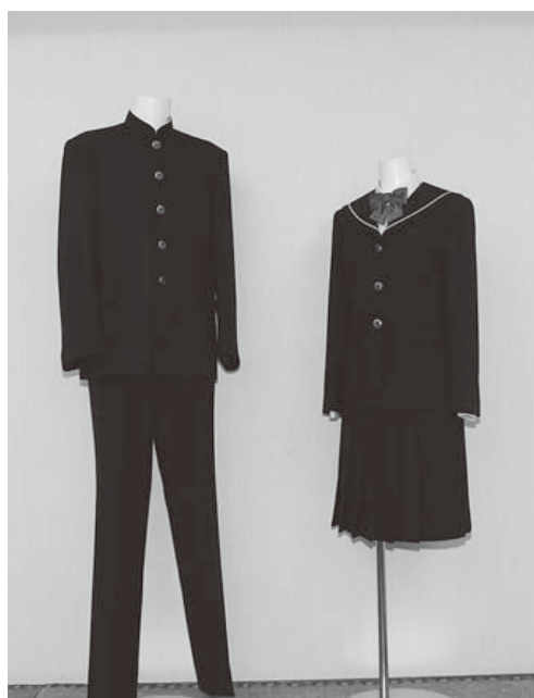
決定した新制服です。 細部については町ホームページに掲載しています。

▼平成25年度から工事中工予定です。来年度決定する施工業者と綿密な調整をし、十分配慮するようにします。