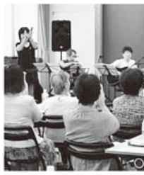
▲うたごえ喫茶の様子

▼申込・問い合わせ あゆーむ生演奏を伴奏に、みんなで歌をうたいましょう。唱歌・歌謡曲・フォークなど：誰でも一度は聴いたこと、歌ったことのある名曲ばかりです。歌本からのリクエストも受付ます。