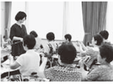
▼前回の講座の様子