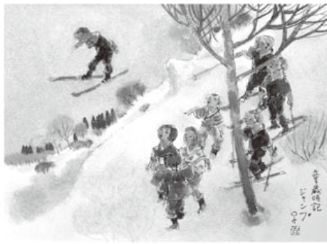
▲《童歳時記 ジャンプ》

今は失われた昔の子どもの日常、学校生活。打田早苗のやさしく確かな目が、遠い心のふるさとの記憶を郷愁とともに蘇らせます！