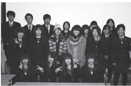
東北芸術工科大学の学生さんから「企画」について学びました。