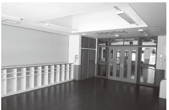
さくらの保育園「保育室」