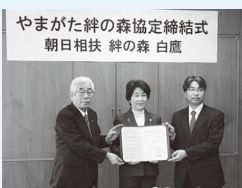
やまがた絆の森協定締結式 朝日相扶 絆の森 白鷹

(株)朝日相扶製作所は木製家具の製造を手掛ける会社であることから、活動の中で社員教育を目的とした森林保全活動に取り組んでいきます。