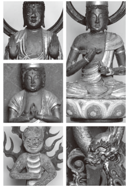
▲《御沢仏》のうち 右上《御釜明王像》 右下《剣ノ明王像》 左上《日月燈明仏像》 左中《十三仏像》 左下《波分不動明王像》