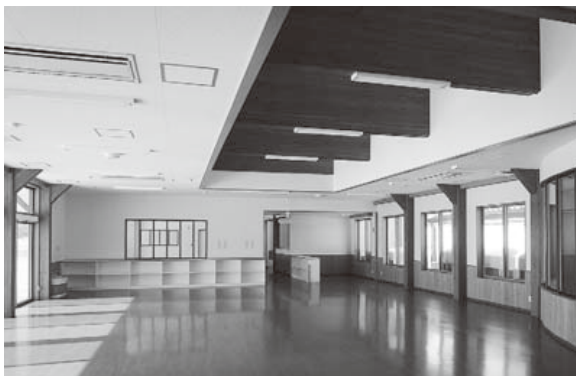
子育て支援センター「わんぱくホール」

※施設では保育業務等を実施しておりますので、業務の妨げにならないようご協力ください。