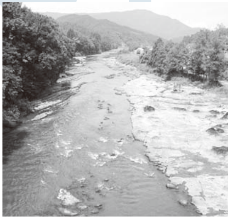
豊かな自然の象徴「最上川」