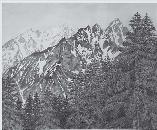
「奥穂高岳 徳本峠より」