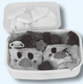
『ぴよぴよ ひよこ オムライス弁当』 和栗沙季さん(荒砥高校)