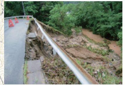
▲ 38 中丸公園新地線