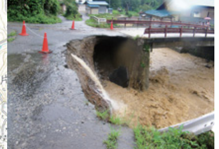
▲ 36 黒鴨川前線