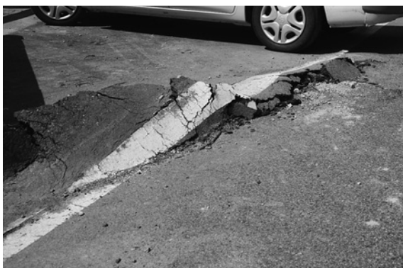
▲地滑りが原因で路面に隆起や亀裂が発生している国道287号。復旧のめどは立っていない。