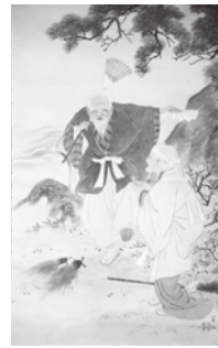
▲笹原富山 <高砂> 部分 (個人蔵)