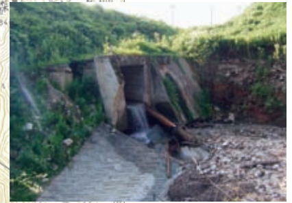
▲ 31 唐松沢