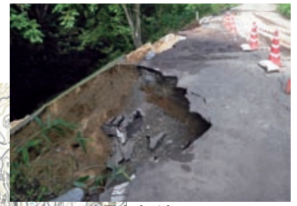
▲ 27 置賜東部線