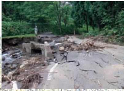
▲ 22 小野ヶ入線