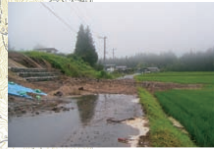
▲ 33 橋本新田線