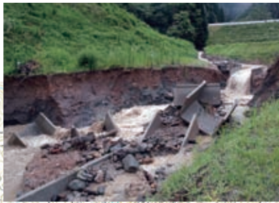
▲ 14 朝日沢