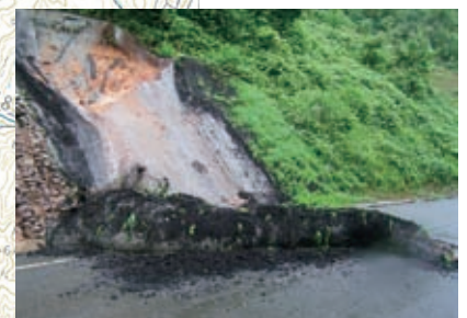
▲ 37 菖蒲萩野線