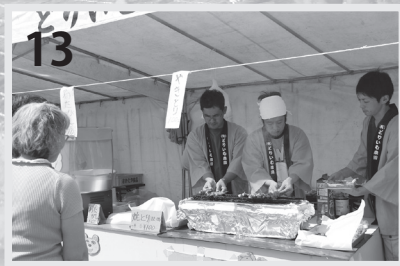
1. 2. 3. 4. 5. 6 / 白鷹鮎まつり 7. 8. 9. 10 / 工芸体験まつり 11. 12. 13 / うんまえもの茶屋