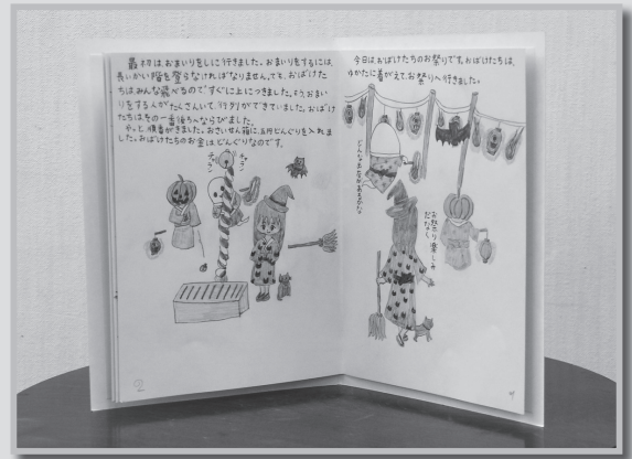
アートキッズ団の作品