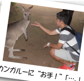
カンガルーに“お手！”「…。」