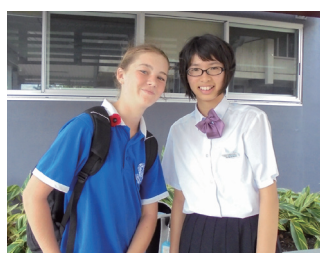
学校での相棒“バディ”！