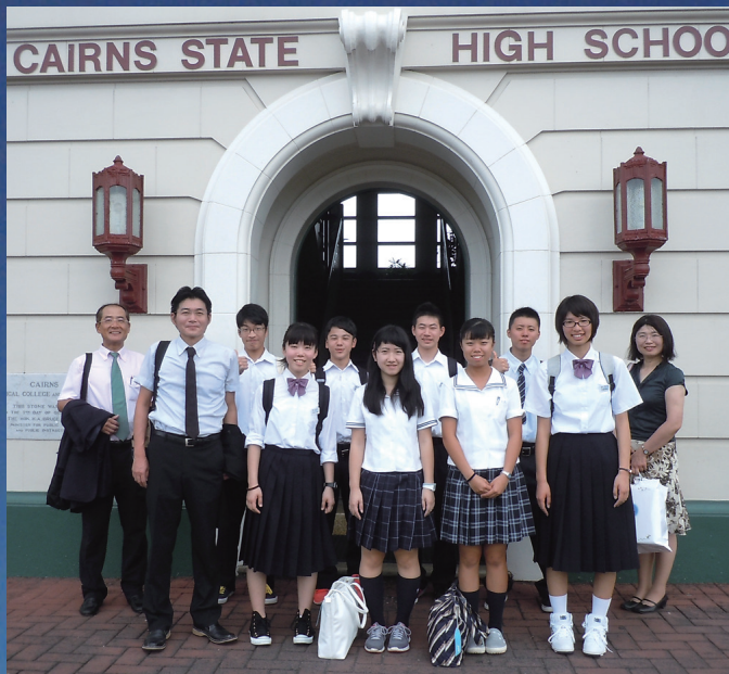
↑訪問先の学校「Cairns State High School」(ケアンズ州立高校)の前で