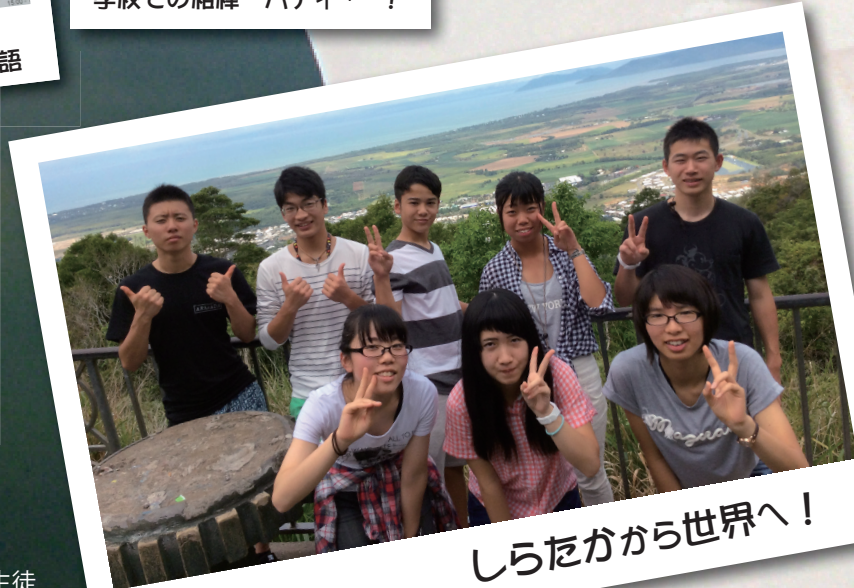
しらたかから世界へ！