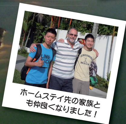
ホームステイ先の家族と も仲良くなりました！