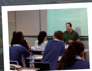
現地の生徒と一緒に授業中