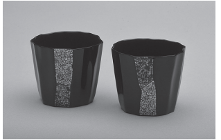
▲第4回そば猪口アート公募展 大賞 田中若葉《ゆらり》