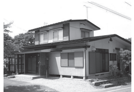
現在、町内では6件の空き家が空き家バンクに登録されている

白鷹町では、町内空き家の増加、若者世代や移住者の住まいに関する相談の増加に対応するため、町内事業者と協議を行い、町内の不動産業者で組織する「白鷹町空き家対策ネットワーク協議会」が空き家バンクを運営することとなりました。