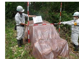
（事業1：松くい虫防除事業）