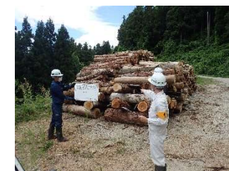
（事業2：森林環境保全整備事業）