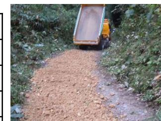
（事業3：林道整備事業）