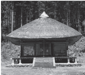
観音寺観音堂(深山観音)