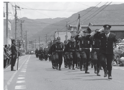
分列行進の様子(荒砥仲町通り)