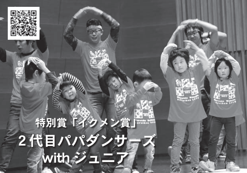
特別賞「イクメン賞」 2代目パパダンサーズ withジュニア