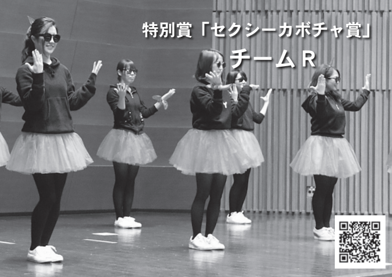
特別賞「セクシーカボチャ賞」 チームR