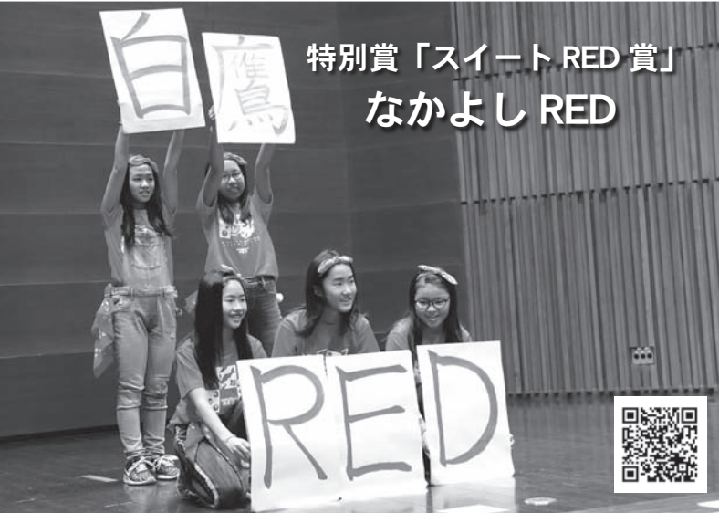
特別賞「スイートRED賞」 なかよしRED