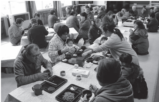
多くの家族連れなどでにぎわったそばまつり会場