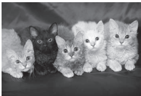
▲ 撮影・五十川 満

で認められた55の純血猫種のなかでも、とりわけ登録頭数が少ない稀少猫種「ラパーマ」を中心に、CFAに登録されたまさに「世界一」美しい猫たちの写真展です。