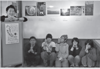
みんなの協力で楽しく、真剣に、時に厳しく作業ができました。本当にありがとう

10月末。荒砥駅資料館の展示スペースが空いていたため、町内のことがわかるような何かができないかと思ひ、写真展を企画しました。荒砥駅は始発駅であり終着駅でもあるため足を止めてもらえる機会が多く、ツアーなどで団体のお客様も多数お立ち寄りくださるので、多く