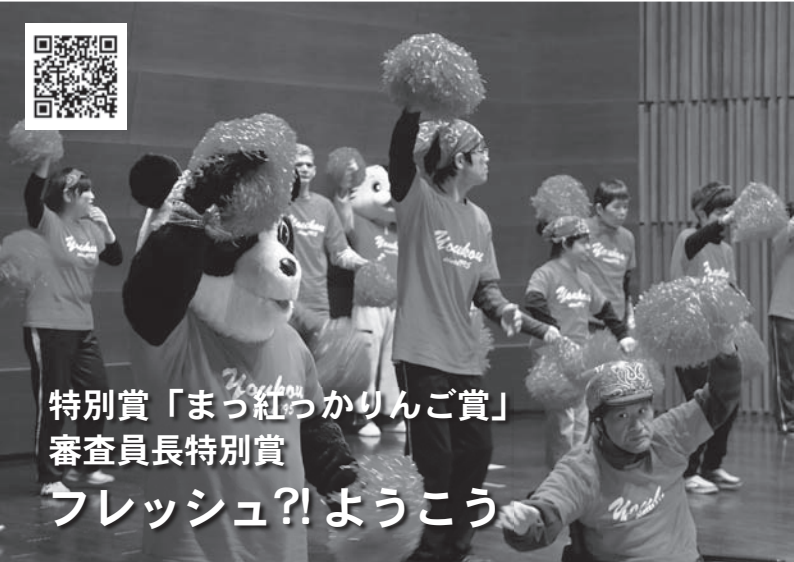
特別賞「まっ紅っかりんご賞」 審査員長特別賞 フレッシュ?!ようこう