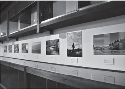
隊員それぞれが持ち寄った作品の中から厳選した30点を展示しました

10月末。荒砥駅資料館の展示スペースが空いていたため、町内のことがわかるような何かができないかと思ひ、写真展を企画しました。荒砥駅は始発駅であり終着駅でもあるため足を止めてもらえる機会が多く、ツアーなどで団体のお客様も多数お立ち寄りくださるので、多く