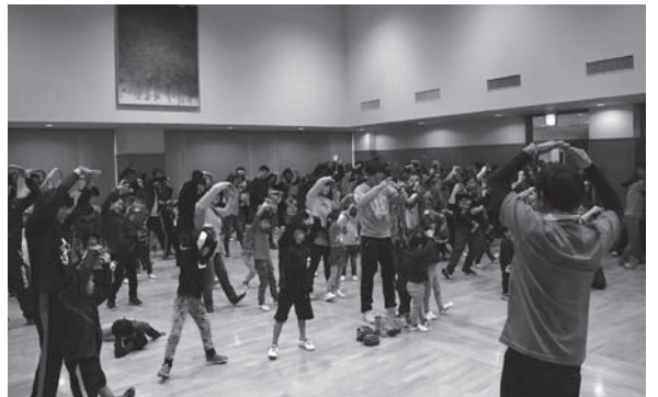
おなじみの「おどる！シラタカ・レッド」を元気よく踊る参加者