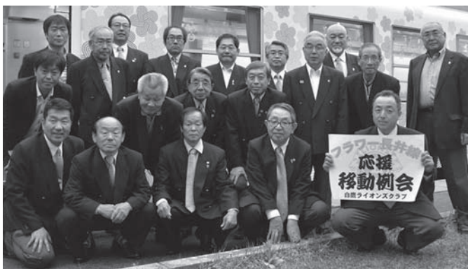
最優秀団体の白鷹ライオンズクラブ移動例会参加メンバー

今年も“隠れ蕎麦屋の里”には、新そばの香りに誘われるかのように多くのそば好きが訪れ、会場の前に列を成しました。来場者は、そば打ち名人たちが腕をふるった新そばを口に運び「うまいっ」と絶賛。中には、一人で2枚、3枚とそばを注文する人も多く、次々とおいしそうにそばをすする音が響きました。