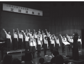
第6回定期演奏会の様子