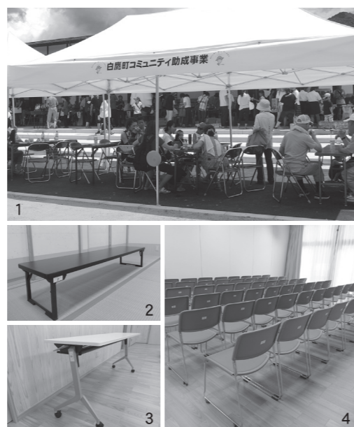
1_イージーアップテント 2_和机 3_フラップテーブル 4_肘なしチェア