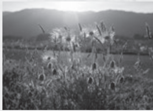
最上川河川敷に咲く オキナグサ

さて、最上川の河川敷を散歩中にオキナグサ（翁草）の群生に出くわしました。全国的に見れば環境省の絶滅危惧種Ⅱ類に指定されている希少な植物で、ついつい撫でたくなるふわふわの綿毛が白髪のお人のように見