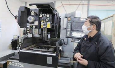
ワイヤー加工機(材料をワイヤーで切断する)