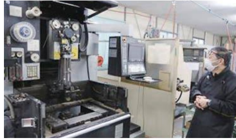
ワイヤー加工機(角形の加工に向いている)