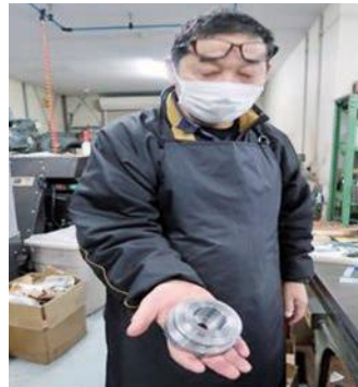
丸形状の加工品 (NC旋盤の有効化)

※他には、平面研削盤、チタン材切断用のブレードソー、成型研削盤などがあり、ほとんどの加工が行える。