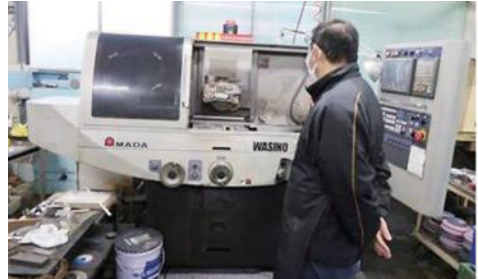
NC旋盤(材料を回転して切削する)