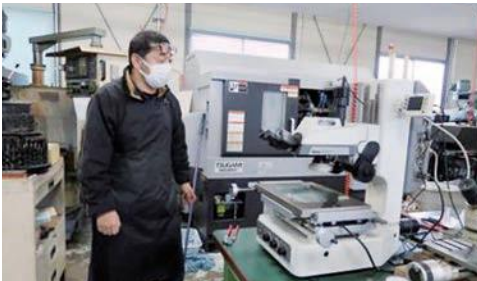
工具顕微鏡(仕上がり寸法を測定する)