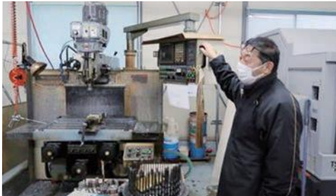
NCフライス(切削刃物を回転させて切削する)