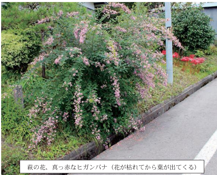
萩の花、真っ赤なヒガンバナ（花が枯れてから葉が出てくる）