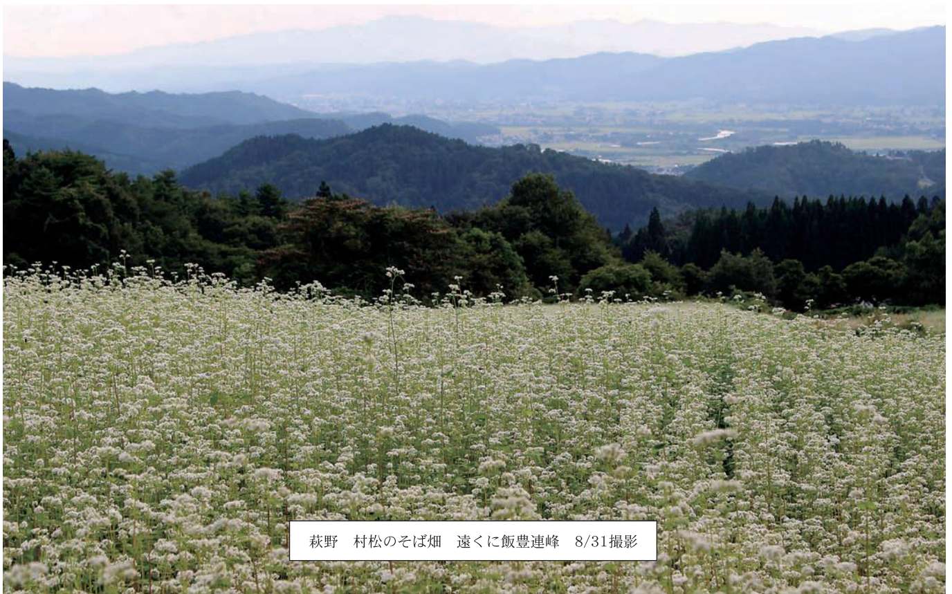
萩野 村松のそば畑 遠くに飯豊連峰 8/31撮影