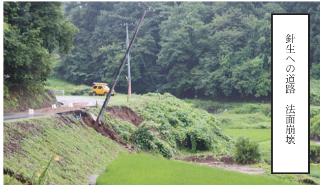
針生への道路 法面崩壊