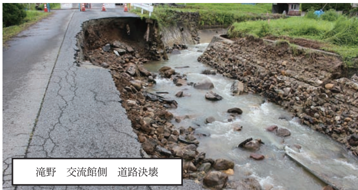
滝野 交流館側 道路決壊