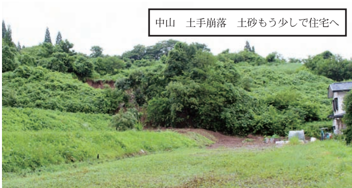
中山 土手崩落 土砂もう少しで住宅へ