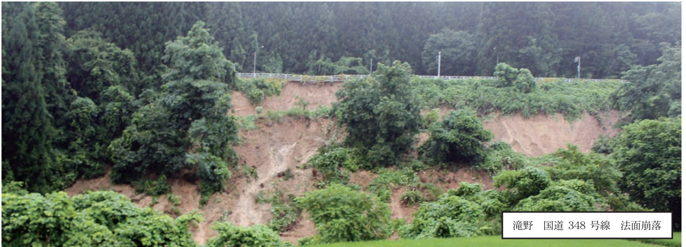
滝野 国道 348 号線 法面崩落