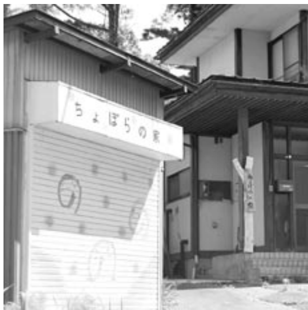
平成16年5月に、開設された「ちよぼらの家」