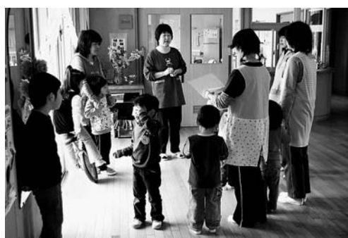
引き継ぎ保育 よつば保育園