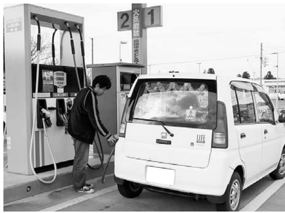
暫定税率の影響は

1億円増の地方交付税 議員 平成20年度の地方交付税が、前年度との比較で1億円増えていますが、理由を伺います。 当局 国で「地方再生対策費」が創設されて、4000億円が予算措置されたので本町分として算定したものです。 今後はどうなる 議員 三位一体改革や行財政改革により地方交付税が実質的に削減されているなか、今年度は増額となったが、来年度以降はどうなりますか。 当局 平成20年度の地方交付税は19年度よりは増額になっていますが、18年度より減額になっています。「地方再生対策費」は恒久措置ではないので、国の動向によって変わると思います。 町民との信頼関係 議員 住民の負担増やサービス低下がともなう経費の削減は、行財政改革の成果ではないという認識をしなければ、町民との信頼関係が保てないと思いませんか。 当局 何が成果で何が住民に対する負担増になるのか総合的に判断していきます。 行財政改革の効果 議員 地方は、さらなる行財政改革を推進すべきという流れのなかで、白鷹町の集中改革プランの効果伺います。 当局 平成12年度を基準に、13年度から18年度までの6年間で経費の削減額は、収入の廃止・時間外手当などの人件費や物件費などで合計11億2300万円にわたっています。