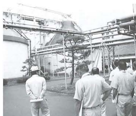
長井クリーンセンター

9月16日に本委員会を開催し、副委員長の互選と請願審査3件並びに所管事務調査を行いました。 請願審査では、採択が2件、不採択が1件になりました。 「後期高齢者医療制度の撤廃を求める請願」は不採択になりましたが、委員から「見直しを求める意見書の提出をしてはどうか」との提案がありました。委員会としての提案はできないが、賛成者を募って発議することです承されました。 「電源開発促進税の見直しと新たな自然エネルギー促進法の制定を求める請願」は、税の有効利用と自然エネルギーを導入した電源開発が必要と採択されました。「障害者自立支援法の抜本的改正を求める請願」につ