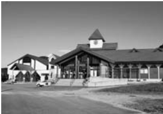
介護施設への改修が待たれる中山小