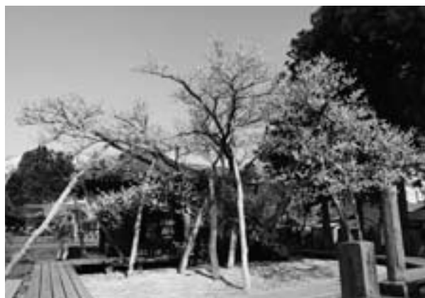
町指定文化財の薬師桜