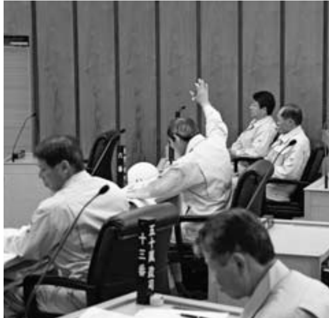
大震災により防災服での議会審議