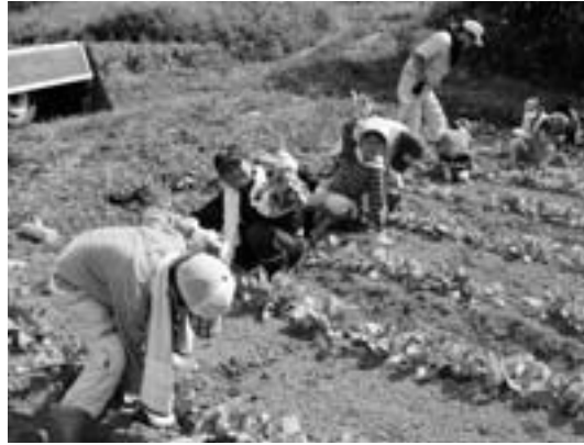
環境にやさしい農業へ