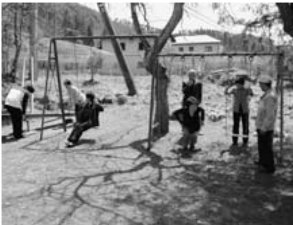
遊具の点検をする民生・児童委員

町長 民間の長所は積極的に導入し、研修の充実による職員の意識改革などに務め、民間ビジネスのスピードと町民ニーズに対応できる行政運営と効率的な組織体制を整備していきたい。