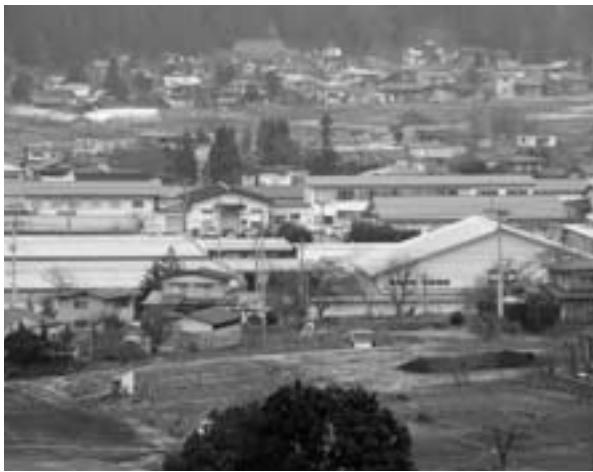
町内企業が集まる東部工業団地