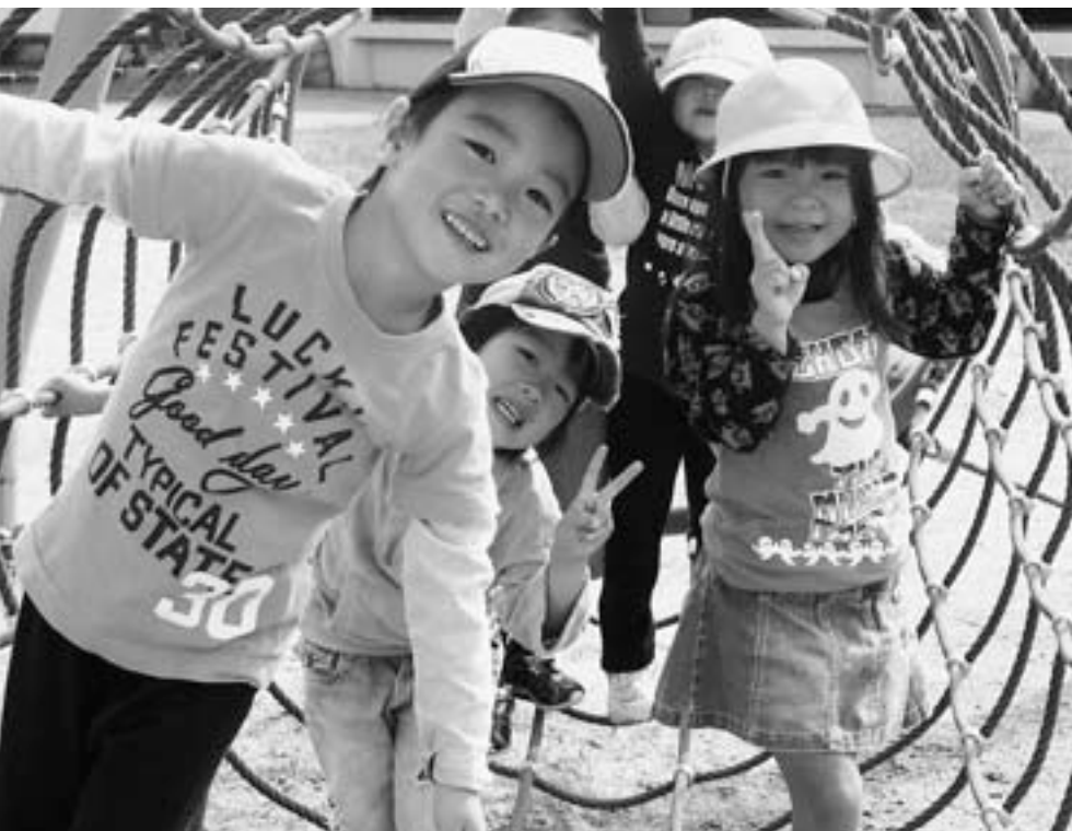
子供たちの未来のために（ひがしね保育園）