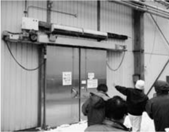
町内経済の活性化策は