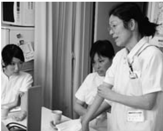
健全経営にはスタッフ充実を

進んでいるのか。 当局 現在10対1看護という基準で算定していて、夜勤交代や患者増加を考慮し32名の看護師が必要。今のところ基準に合うように充足している。医師確保を含めて医療スタッフ確保が優先課題です。