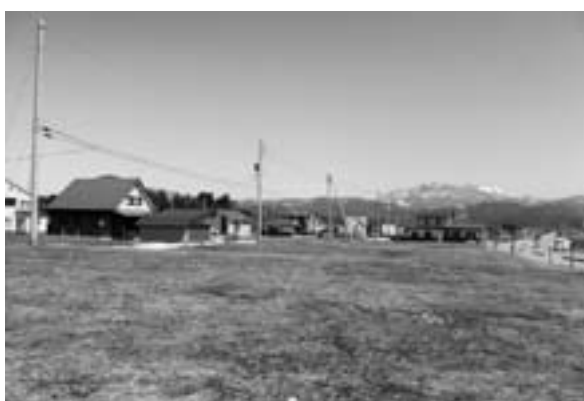
清算が待たれる四季の郷