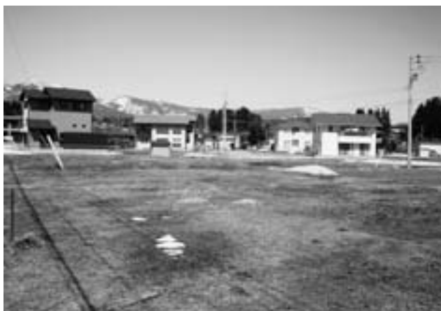
保留地の販売促進を効果的に

業、より効果的にするためのPR、組織的対応はどう計画しているか。既に購入し定住している方との整合性はどうするのか。 当局 保留地の販売促進を促す事業であり、事業年度を2年延長した事業へ支援として技術的支援策、企業への販売促進PRなどすすめます。土地購入者に対し、県外の方には70〜100万円、町外の方には50万円を補助します。