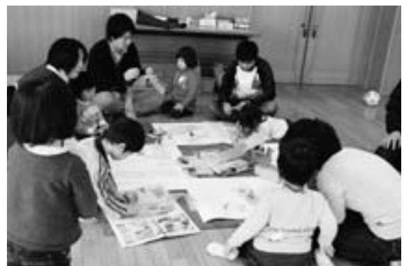
次代を担う子どもたち

当局 介護保険や認知症などに関する相談がふえていくが、ケアマネジャー業務の体制を整えて虐待などの相談にも対応できるように体制を整えていきます。