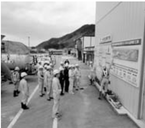
建設労働者の条件確保へ

町長 低入札価格調査制度導入は、品質確保はもとより労働単価、労働条件のチェックに資する制度として導入しています。また建