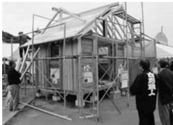
地場産材利用の建築を