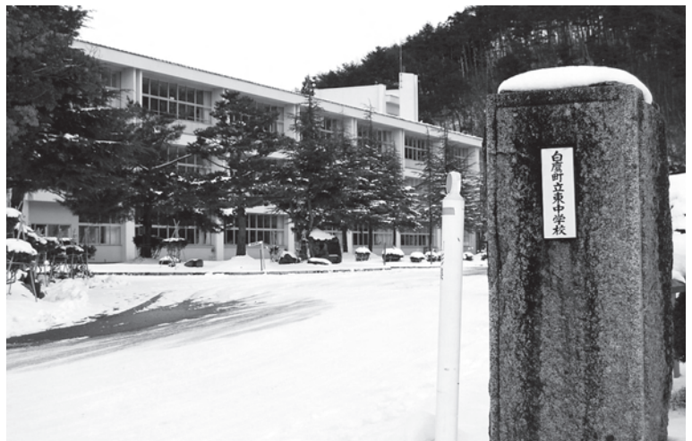
統合後は「白鷹中学校」となる現在の東中学校

その後、現地調査を行いました。 ④では鷹山小学校災害復旧工事について、12月12日