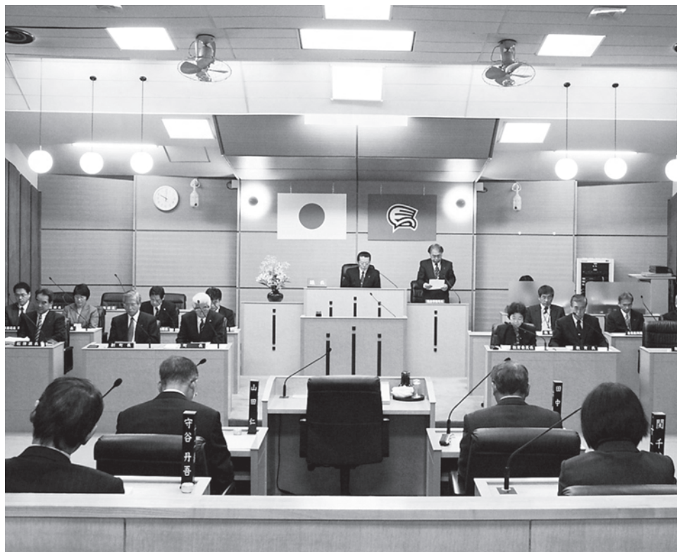
12月定例会（本会議場）

従来の議会運営は、議員と町当局との議論が中心であり、議員間での自由な発言や討論などは多くありませんでした。今後は、町の重要な課題や案件・請願などで、議員同士の自由討議が行われるようになります。