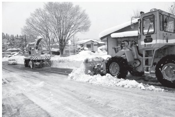
生活道路の確保のために（除雪作業）