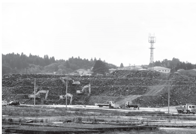
現在、復旧中の被災地（気仙沼市）

この度の研修は、議会基本条例の制定や議員間の討議の実施などを議会活性化特別委員会で検討をすすめながら、できるところから実施していくことが重要であり、町民の皆様の負託に応えられる議会として、議員の資質向上に努めることを学んだ研修でした。