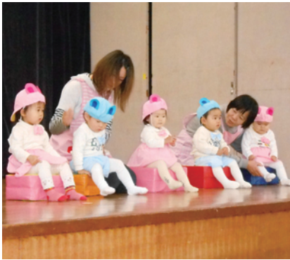
健やかな成長を願って (あゆかい保育園)

また、出産などにかかる経済的な負担軽減をはかるため、平成22年度から「ニコニコマタニティライフ応援事業」を実施、1人3万円の助成を行っています。