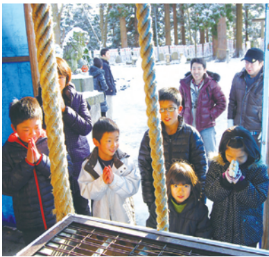
新年の初詣 (鮎貝八幡宮)