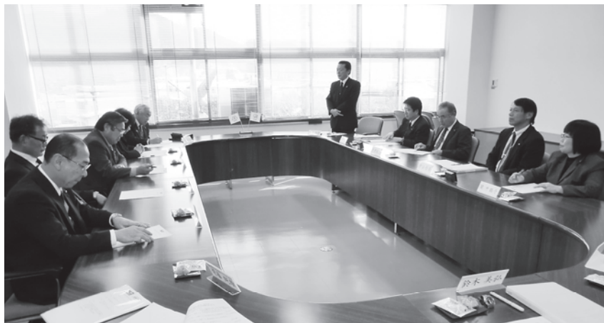
議会活性化について飯豊町議会の議会運営委員会委員との研修