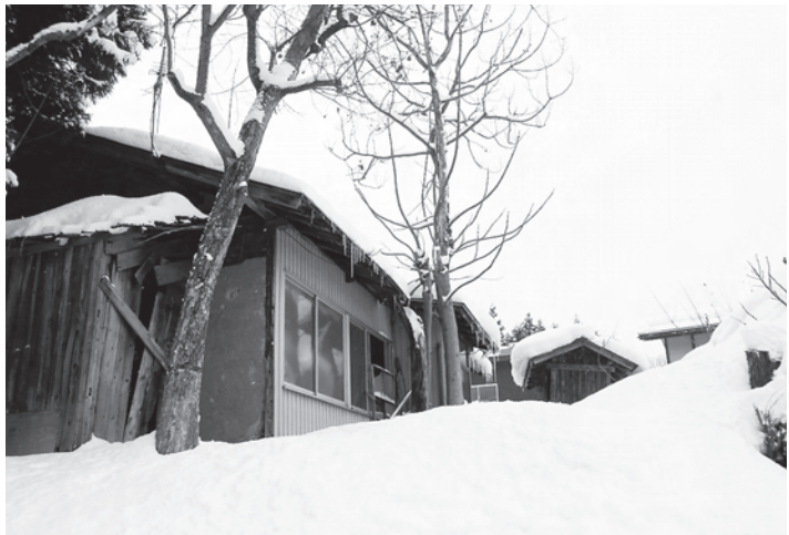
周辺に危険がおよぶ恐れのある空き家