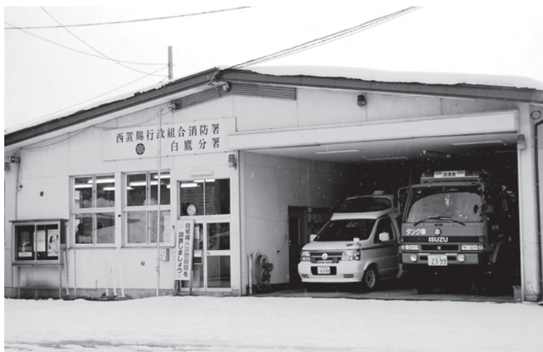
西置賜行政組合消防署 白鷹分署