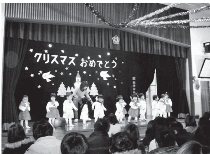
クリスマス発表会（あらと保育園）