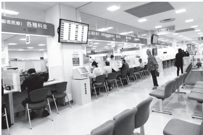
ワンフロア・ワンストップサービスの区役所（新潟市東区）

わが町の、公共施設の再配置計画などの検討過程においても町民の意見、要望が十分に反映され、住民満足度を高めることが必要です。議会においても町民の意向が何より重要であることを念頭に、施設整備に関する計画、事業の進ちよく度合いを注視し、将来を見据えた町づくりに資するものにしなければなりません。これらを重視し、さらなる町民の満足度を高めるための提言や調査研究に努めて行くことを学んだ研修でした。