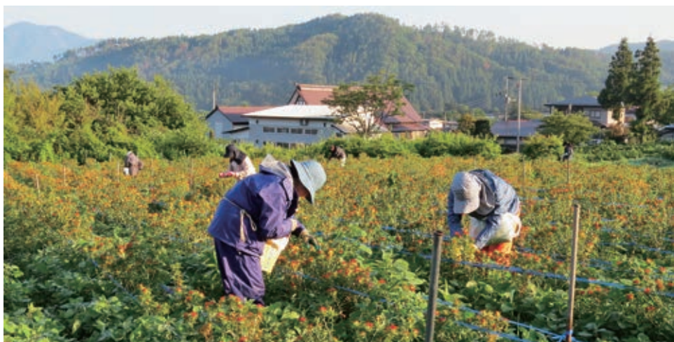
紅(あか)をそだてる誇りと喜び