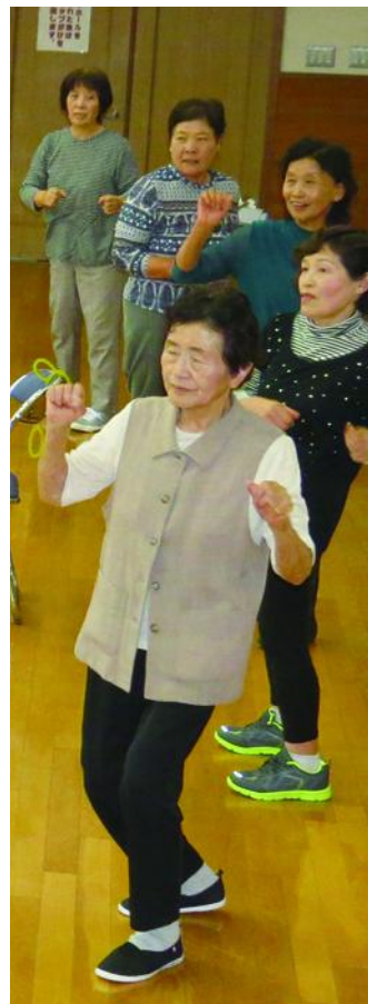
健康寿命の向上を