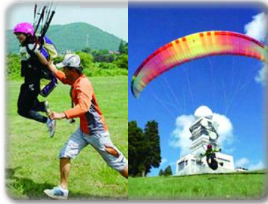
スーツの仕立てやパラグライダー体験などの返礼品