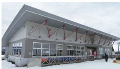
白鷹スキーセンター