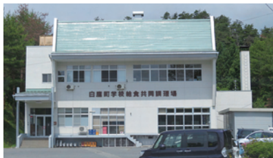
学校給食共同調理場